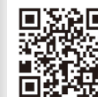
[webオープンキャンパス]